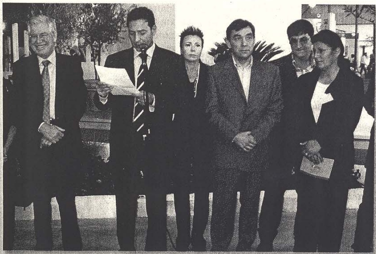
Inaugurazione della manifestazione con il Presidente della Regione Marche, Vito d'Ambrosio, il Presidente dell'ERF, Sandro Barcagliani e l'Assessore all'Ambiente, Marco Amagliani

Il secondo convegno, dal titolo "Le buone pratiche di integrazione ambientale nelle Marche", è stato organizzato insieme all'Autorità Ambientale. In questo caso sono state presentate concrete esperienze, provenienti sia dal settore privato che da quello pubblico, di programmi, progetti e singole azioni che hanno trovato applicazione sul territorio regionale e che hanno comportato un miglioramento dell'ambiente. Gli interventi erano organizzati per settori economici, in linea con il principio alla base dell'attività dell'Autorità Ambientale Regionale, cioè quello dell'integrazione ambientale nelle politiche settoriali. Per quanto riguarda il settore