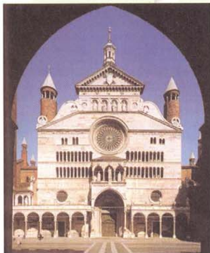
Il Duomo di Cremona

a caso la sperimentazione avviata dalla Provincia di Cremona suscita un crescente interesse a livello nazionale ed internazionale, tanto che l'amministrazione cremonese è spesso invitata a discutere il GPPnet in occasione di convegni, corsi e seminari in Italia e in Europa. Tra le varie partecipazioni si ricordano: il convegno " Green Procurement: gli acquisti verdi della Pubblica amministrazione ", organizzato lo scorso