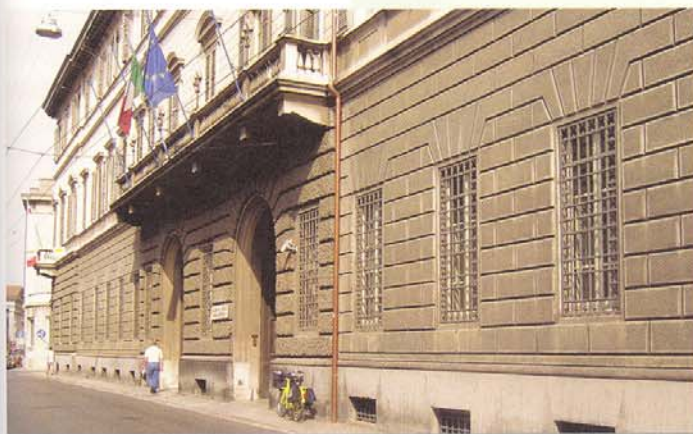
Sede della Provincia di Cremona

Da sottolineare anche l'interesse del Comune di Roma, della Provincia di Varese e dell'ARPAT Toscana, che negli scorsi mesi hanno chiamato la Provincia di Cremona a presentare la sperimentazione del GPPnet nell'ambito di convegni e seminari. Anche il calendario dei prossimi mesi continua ad essere particolarmente fitto di impegni: dal convegno " SEP Pollution " a Padova in marzo, alla conferenza internazionale " Eco-efficiency for sustainability ", a Leiden (Olanda) e la fiera " Terra Futura " di Firenze in aprile, fino all'appuntamento di Ålborg, in Danimarca, in occasione della " IV Conferenza Europea sulle Città Sostenibili ", il prossimo giugno.